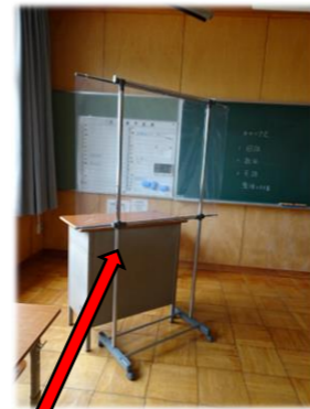
飛沫遮へい板 (教卓の前にあるラックです)